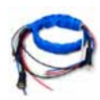
PROPOJE 2-15 m